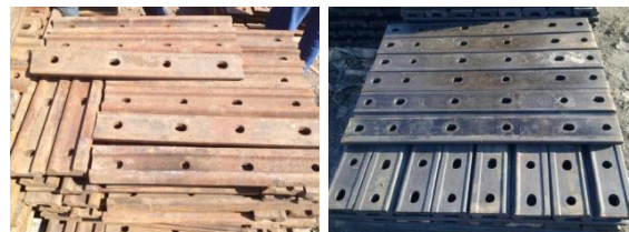
Накладка 1Р-50 б/у и 1Р-43 б/у