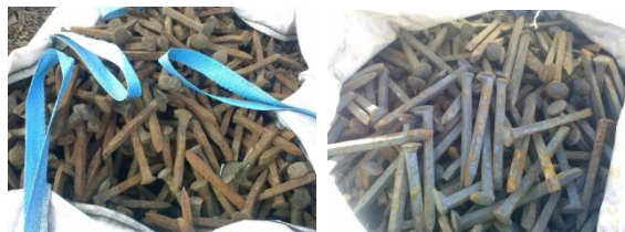
Костыль 16x16x165 б/у перебранный