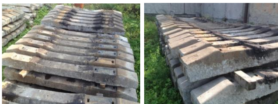
Шпала железобетонная Ш1 б/у