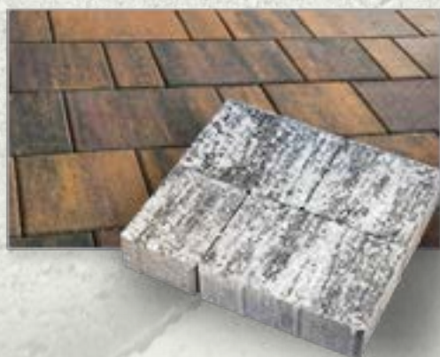
КОЛОРИМИКС, ПРЕМИУМ ЭКО